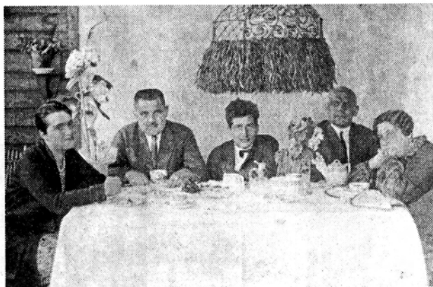
А. Варламов (в центре) с родными. 30-е гг.

В годы войны Александру Владимировичу неоднократно предлагали эвакуироваться из Москвы, в тыл, куда советское правительство направляло работников театра, радио, литературы, музыкантов, кинематографистов, чтобы сохранить цвет отечественной творческой интеллигенции. Но композитор не покинул осажденной столицы - его деятельная кипучая натура в тревожные дни осени и зимы 1941 года проявилась во всей своей полноте. В 1942 году Александр Владимирович организует уникальный джазовый состав из смычковых инструментов “Мелоди-оркестр”. Казалось бы, джаз, свинг несовместимы были с понятием “война”, но на удивление в те суровые годы оркестр Александра Варламова находил множество благодарных слушателей. В составе